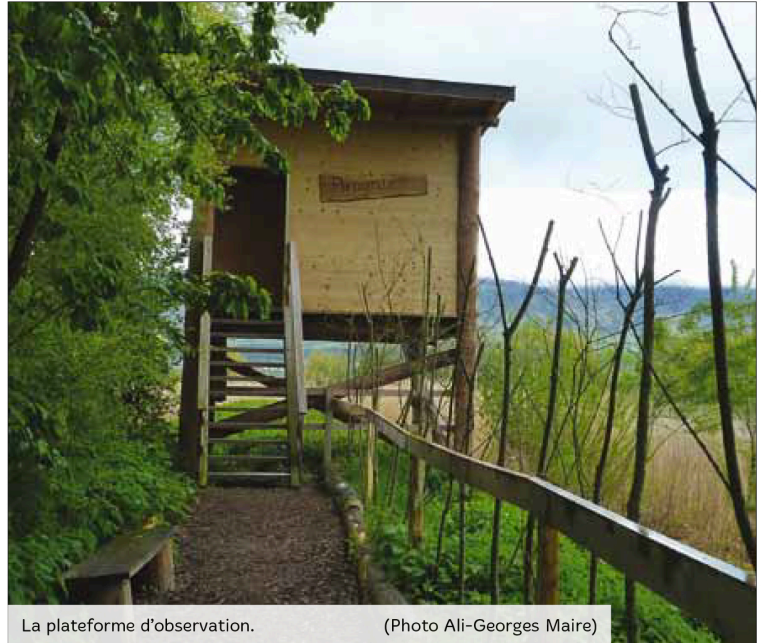
La plateforme d'observation.